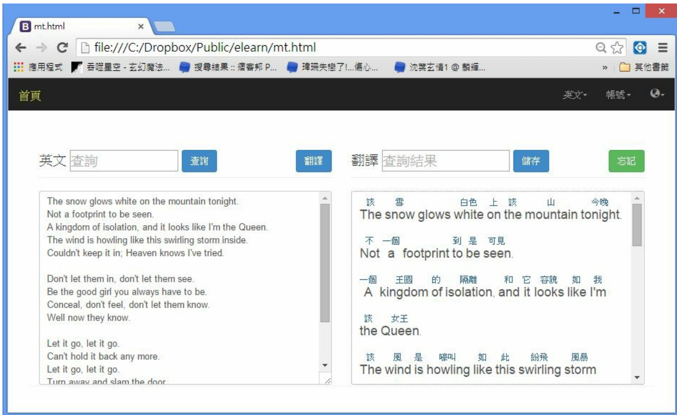
圖、逐字英翻中系統